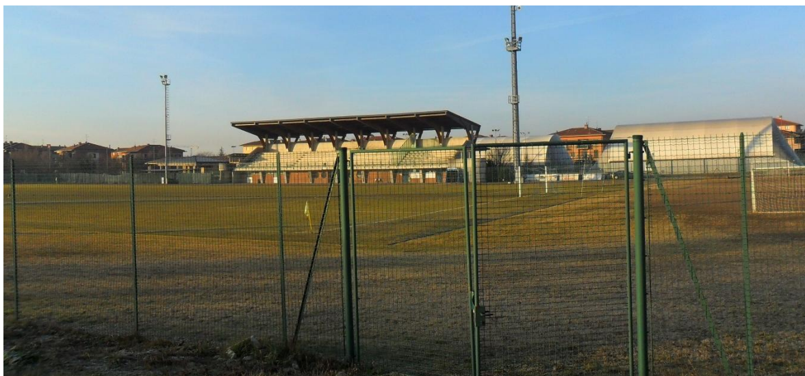
Centro Sportivo Comunale: campo calcio a 11 e tribune