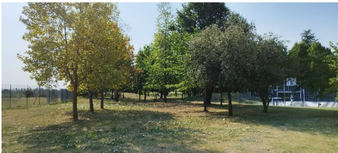
Centro Sportivo Comunale: parco piantumato