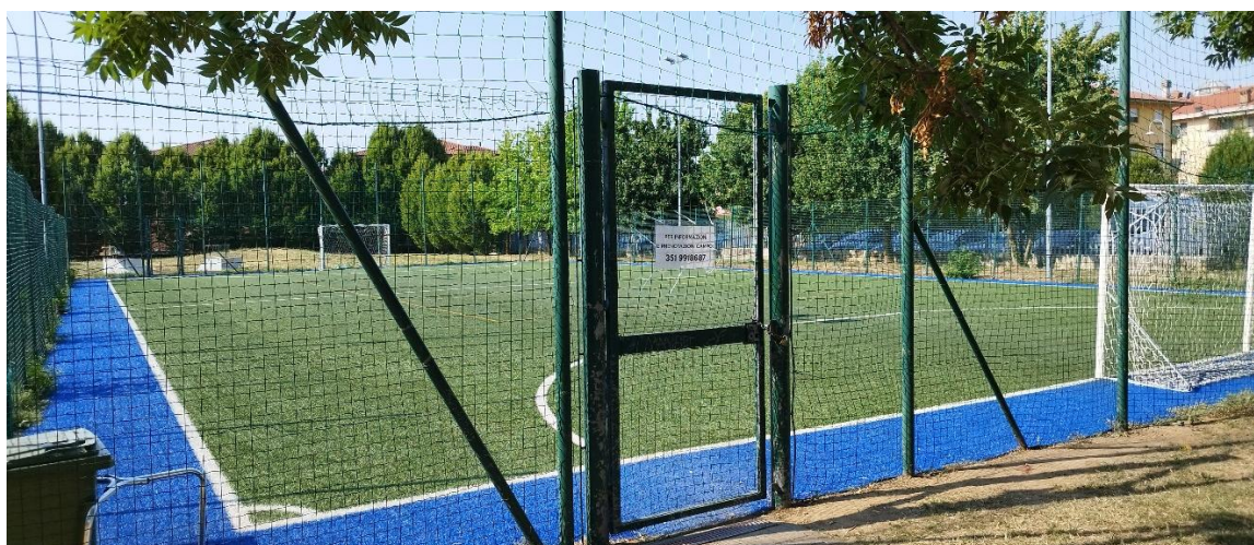
Centro Sportivo Comunale: campo calcio a 5 in erba sintetica