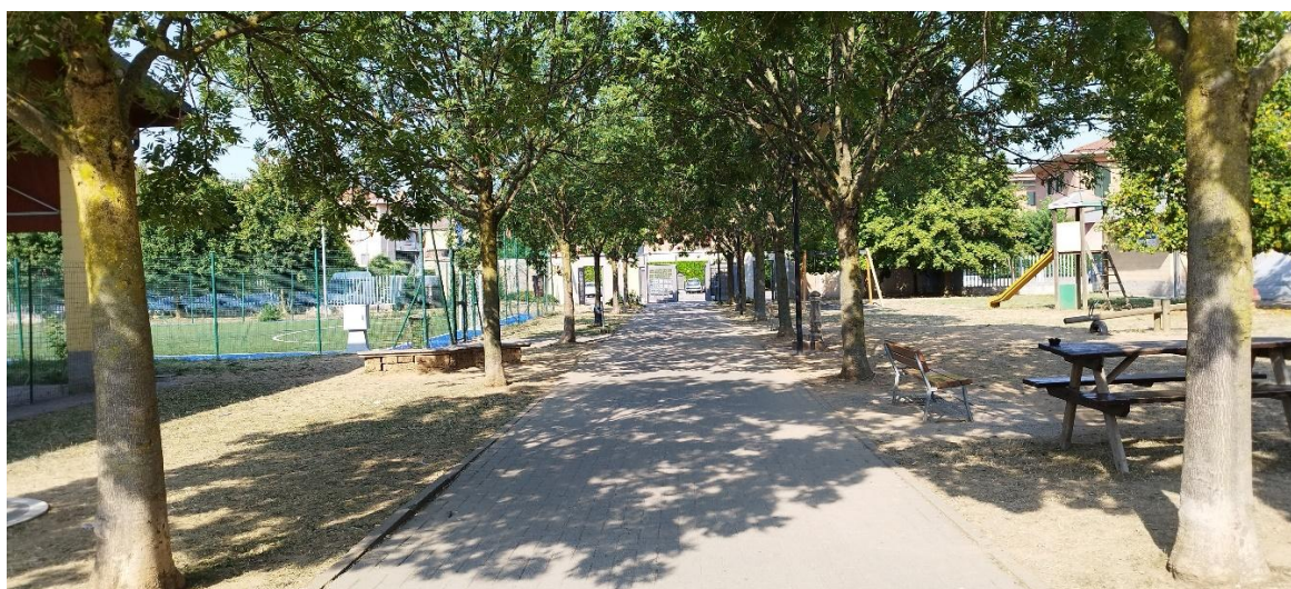
Centro Sportivo Comunale: viale di accesso